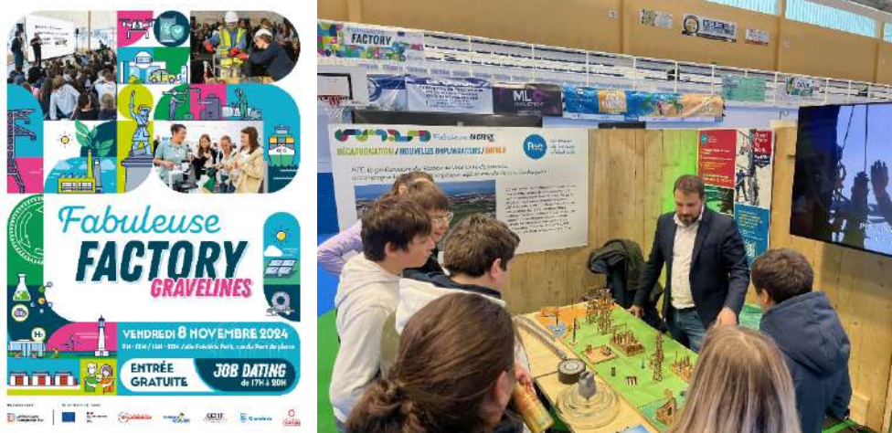
Stand RTE Fabuleuse Factory 2024 à Gravelines

À l'instar de l'événement organisé à Dunkerque, une édition d'une journée de la Fabuleuse Factory s'est tenue dans la ville de Gravelines. RTE y a animé un stand afin d'échanger avec les collégiens, les lycéens et les demandeurs d'emploi du territoire. Les visiteurs ont ainsi pu découvrir les mutations en cours de l'industrie locale, ainsi que les nouveaux projets, emplois et formations qui y sont associés.