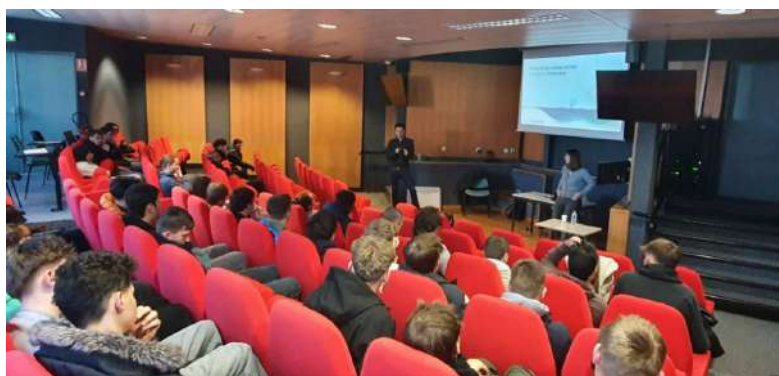
Intervention EMD auprès des étudiants de l'ULCO à Dunkerque

En mars 2025, EMD est intervenu auprès des étudiants de 1 re et 2 e année du BUT « Métiers de la transition énergétique » de l'Université du Littoral Côte d'Opale (ULCO) à Dunkerque pour présenter la filière de l'éolien en mer. Cette rencontre a permis d'expliquer les grandes étapes de développement d'un projet éolien en mer en France, depuis la planification nationale réalisée par l'État jusqu'au démantèlement en fin d'exploitation, et de détailler les enjeux et caractéristiques du projet de Dunkerque. Cette intervention a ainsi enrichi le module « Énergies renouvelables » du cursus suivi par ces étudiants, en apportant une illustration concrète des enseignements théoriques et en sensibilisant les étudiants aux perspectives de cette filière.