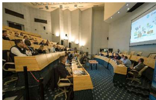
Forum entreprises RTE