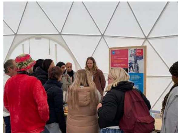
Stand RTE Fabuleuse Factory 2024 à Dunkerque