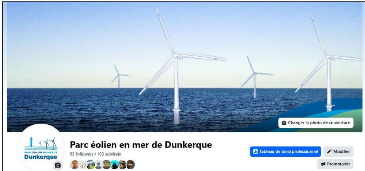
Page Facebook EMD

En avril 2025, Eoliennes en mer de Dunkerque (EMD) a ouvert une page Facebook dédiée au projet de parc éolien en mer de Dunkerque afin de diffuser de l'information de proximité et de partager du contenu de manière régulière auprès d'un public élargi.