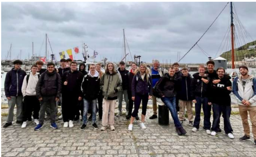
Visite du parc éolien en mer de Fécamp par les élèves du lycée de l'Europe

Le 15 mai 2025, l'équipe d'Éoliennes en Mer de Dunkerque a accueilli des élèves du Lycée de l'Europe de Dunkerque pour une visite en mer du parc éolien en mer de Fécamp. Cette sortie, organisée dans le cadre du partenariat établi pour l'année scolaire 2024-2025 précédemment cité, faisait suite à des cours théoriques sur les énergies marines renouvelables, et a permis aux élèves de passer de la théorie à la pratique.