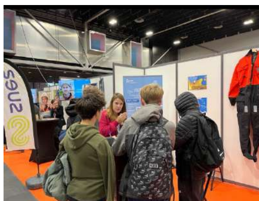
Stand EMD Forum des Fabuleux Métiers 2024