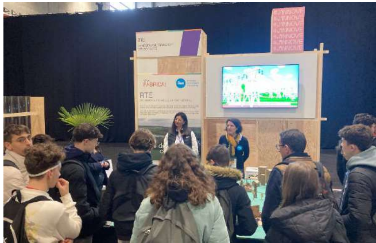
Stand RTE Viva Fabrica 2025