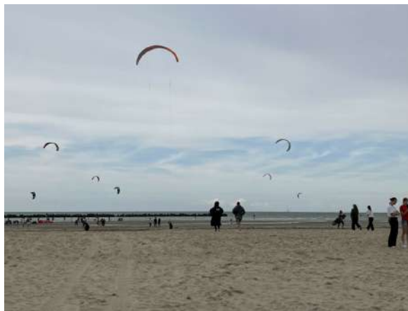
Stand d'information du projet éolien en mer de Dunkerque au « Summer of Kite 2024 »