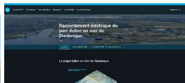
Sites internet projet EMD (à gauche) et RTE (à droite)

Les sites internet des maîtres d'ouvrage sont respectivement disponibles aux liens suivants :