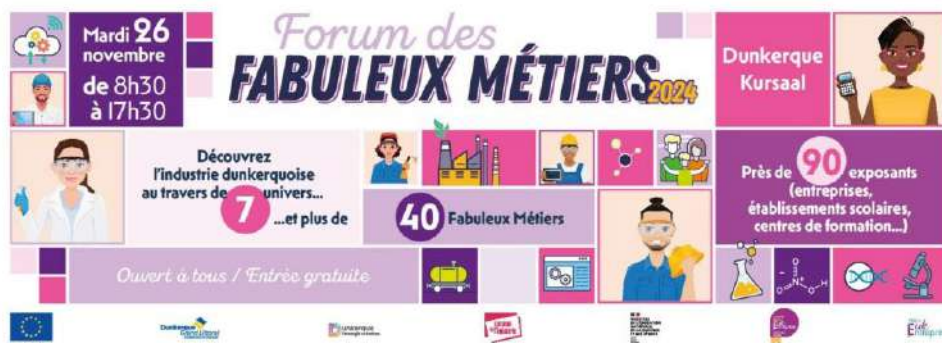
Affiche Forum des Fabuleux Métiers 2024