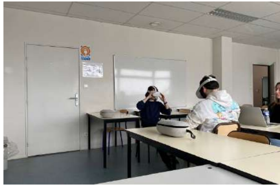
Intervention RTE auprès des étudiants de l'ULCO à Boulogne-sur-Mer

À cette occasion, l'équipe projet RTE a détaillé le projet de raccordement électrique du parc éolien en mer au large de Dunkerque. Par ailleurs, des casques de réalité virtuelle présentant les ouvrages de raccordement en mer, ainsi que des simulations visuelles du projet éolien, ont également été mis à disposition des étudiants afin d'enrichir la présentation.