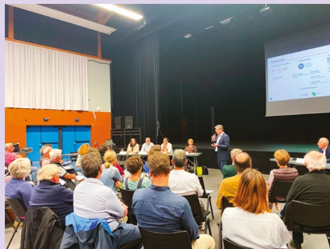
Réunion de clôture de la concertation à Pornic, le 27 mai dernier.

La prochaine étape consistera à soumettre les propositions de fuseaux et d'emplacements de moindre impact, concertées avec les parties prenantes, à la validation des préfets de Gironde et de Loire-Atlantique à l'occasion de deux réunions plénières qui auront lieu en fin d'année à Nantes et à Bordeaux.